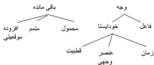
شکل ۱. فرانش بینافردی

مثال: علی (فاعل) دیروز (افزوده حاشیه‌ای) توانست (وجهیت) امتحان خود را (متمم) پاس کند (زمان گذشته + محمول).